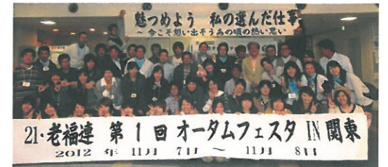
2012 オータムフェスタ写真

開催日程が 決定 しました！ 2013.9.26(木) ~ 9.27(金) 全国から 中堅職員大募集 限定60名