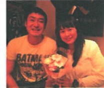
2012年実行委員を された2人の結婚を 新実行委員も祝福