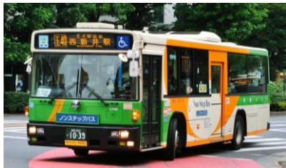
(都営バスイメージ)