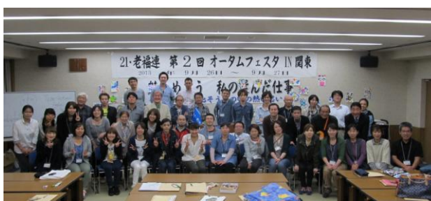
第2回 オータムフェスタ