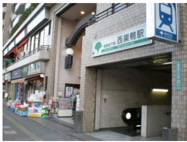
都営三田線 西巣鴨駅 A3出口