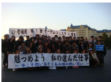
第1回 オータムフェスタ