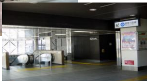
JR・都営三田線 巣鴨駅乗換口