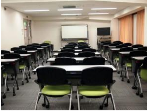
ミーティングルーム(研修会場)