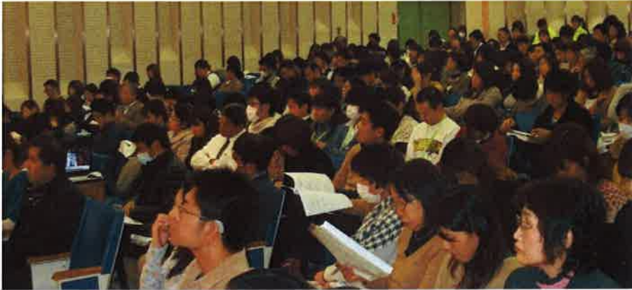
参加者のみなさん

シンポジウムを聞いて、参加者からは「福島原発事故を一度と繰り返してはいけない」と