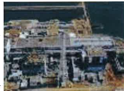
被災後の福島原発